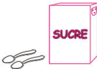
2 cuillères de sucre